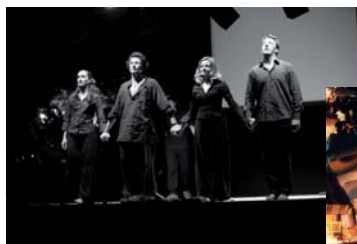
Festival Internacional de Arte dramático