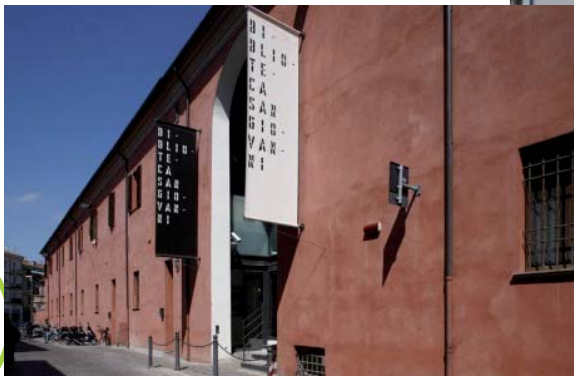
Biblioteca San Giovanni

Uma agradável surpresa é a muitos parques e jardins e cuidada é grande oásis verde que marca a cidade, tanto dentro como fora do perímetro do centro.