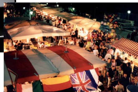
St. Nicholas Fair