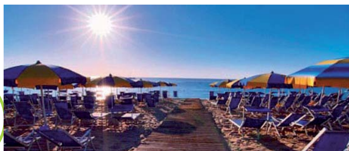
Praias de Pesaro, Viale Trieste

São 7 quilômetros de costa entre a praia e de lazer, alguns anos Pesaro ganhou, para a longa extensão de praia de leste a oeste, a prestigiada Bandeira Azul, que premia os lugares mais virtuoso sobre o meio ambiente e da qualidade da água do mar.