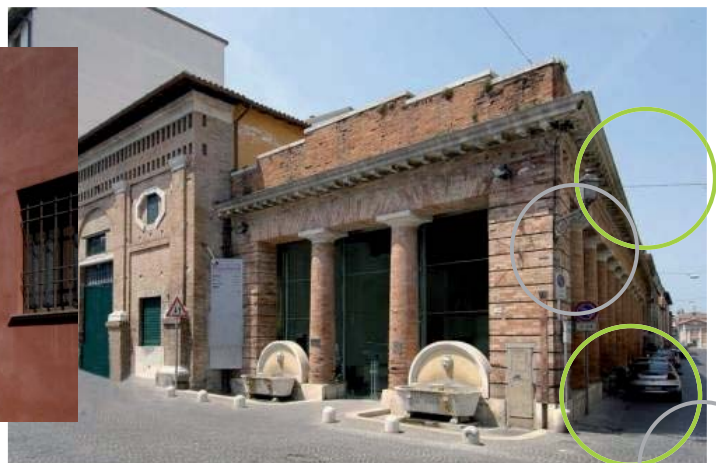
Visual Arts Center Pescheria